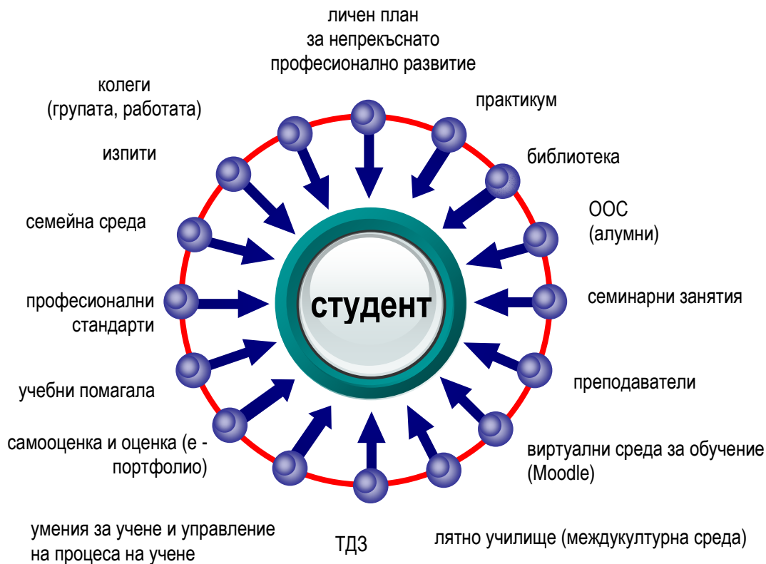
Фиг. 2 Центрирано към студента обучение